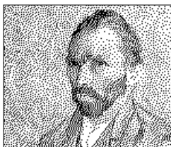
VINCENT VAN GOGH

Der bekannte Professor für Spiritualität kam seelisch immer wieder an seine Grenzen. Mit etwa 50 stieg er aus einer glanzvollen Karriere aus um in einer kleinen Gemeinschaft von behinderten Menschen mitzuleben und sein Leben mit ihnen zu teilen.