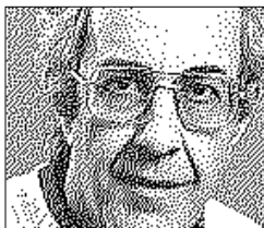
HENRI J.M. NOUWEN

Einer der bekanntesten Modeschöpfer der Welt, enorm kreativ und doch völlig vereinsamt. «Mein einziger Begleiter ist die Angst.»