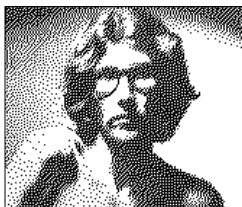
YVES SAINT LAURENT

Die unvergessliche «Rose of England» hatte ein weiches Herz, liebte die Menschen und wurde in den Zwängen des Hofes nicht glücklich. Wegen ihrer Verstimmungen suchte sie bei vielen Therapeuten Hilfe.